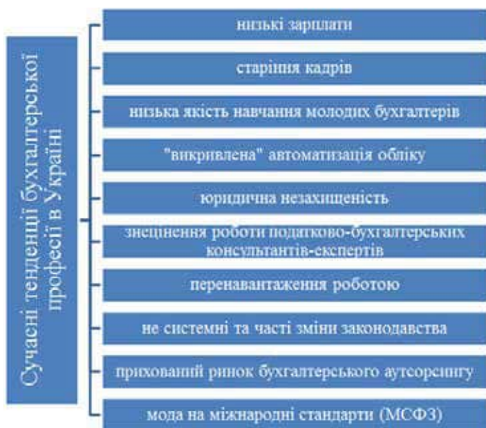
Рис. 2. Сучасні тенденції бухгалтерської професії в Україні

Першочерговим заходом щодо удосконалення розвитку бухгалтерської професії є розвиток аутсорсингових компаній. Вони залучають до себе найкращих та найосвіченіших представників професії та можуть запропонувати їм гідну оплату праці, а ще надають можливість постійно розвиватися. Крім того, вони ж будуть основними замов-