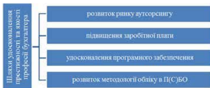
Рис. 3. Шляхи удосконалення престижності та якості професії бухгалтера

Висновки і пропозиції. Отже, на даному етапі розвитку бухгалтерського обліку і бухгалтерської професії неможливі без якісної підго-