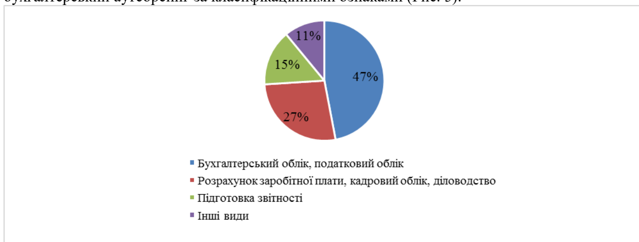
Рис. 4. Структура українського ринку аутсорсингу бухгалтерських послуг (за видами)

Оскільки аутсорсинг тільки розвивається в Україні, то на основі законодавчого регулювання та наукової літератури не можливо чітко сформулювати класифікацію бухгалтерського аутсорсингу. Проте поділ бухгалтерського аутсорсингу за окремими класифікаційними ознаками наведено у науковій літературі, тому доцільним показати бухгалтерський аутсорсинг за класифікаційними ознаками (Рис. 5).