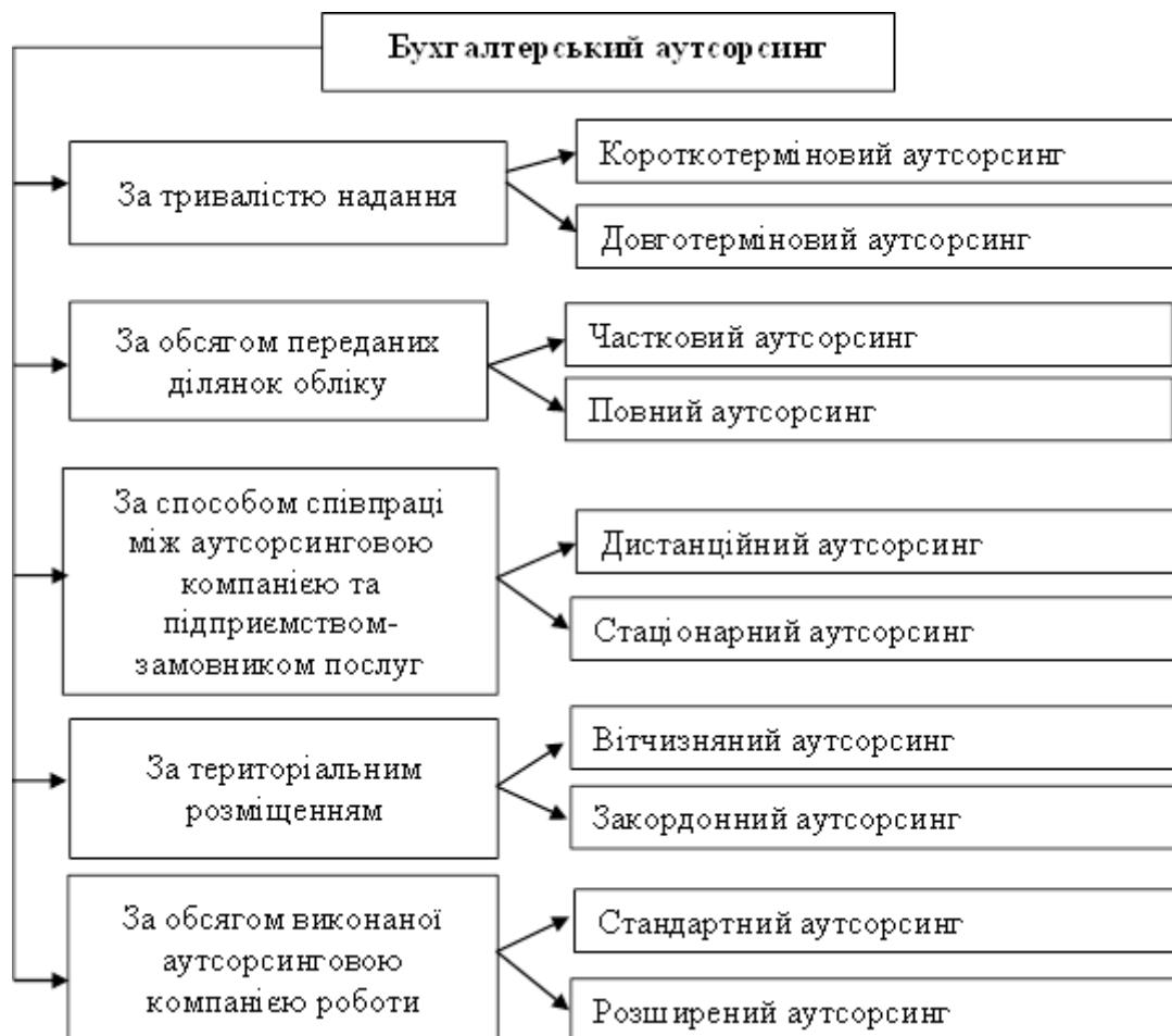
Рис. 5. Класифікація бухгалтерського аутсорсингу

Вибираючи форму організації бухгалтерського обліку на своєму підприємстві керівники чи фізична особа-підприємець повинна ретельно вивчити і проаналізувати переваги та недоліки всіх форм організації обліку, адже від цього залежить подальший розвиток підприємства (Табл. 2).