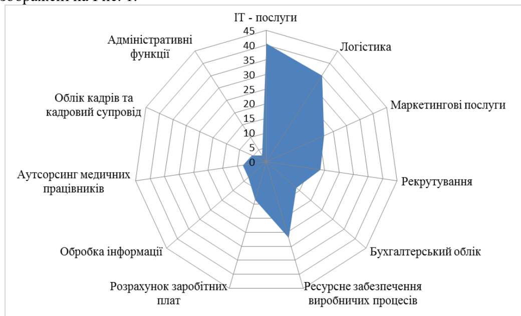
Рис. 1. Структура аутсорсингу в Україні, %

На сьогоднішній день, в Україні на підставі відомостей з Єдиного державного реєстру юридичних осіб, фізичних осіб-підприємців та громадських формувань налічується 143 аутсорсингових підприємств. Найбільші популярні види аутсорсингових послуг в Україні зображені на Рис. 1.