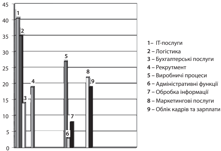
Рис. 3. Динаміка популярності аутсорсингу в Україні