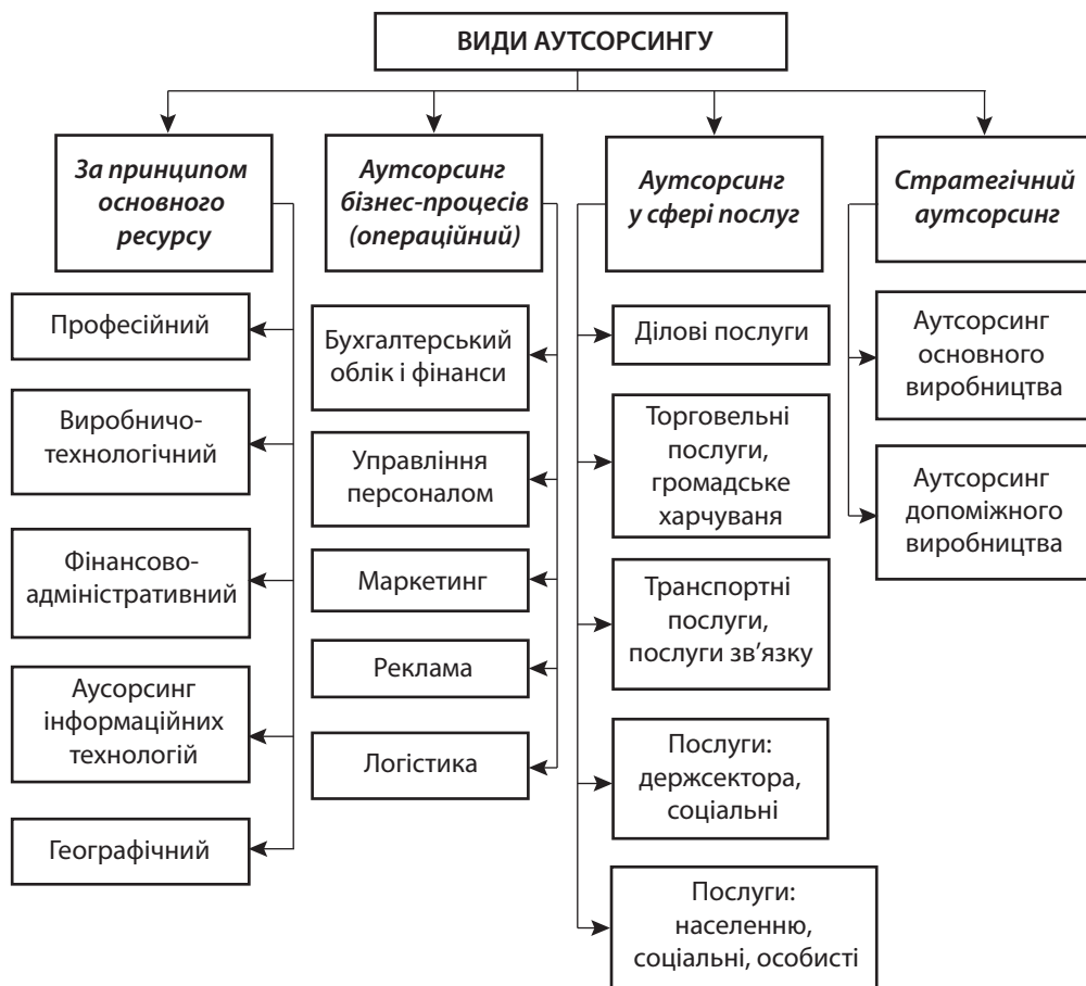
Рис. 2. Класифікація аутсорсингу в системі управління підприємством