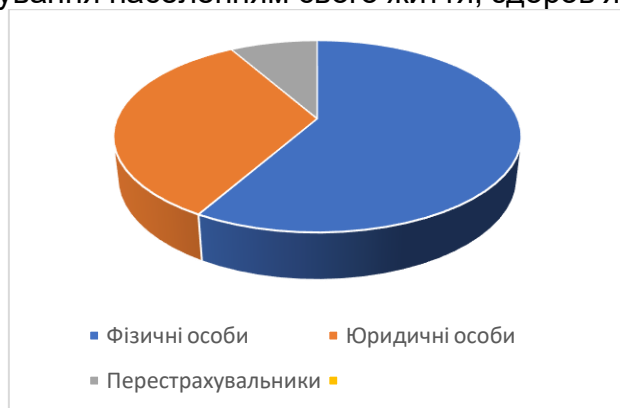
Рис. 1 Надходження страхової премії 2022р.

Валові страхові премії за 9 місяців 2022 року скоротились на 25,5% з 38,1 млрд. грн до 28,6 млрд грн: від страхувальників – фізичних осіб отримано 17,6 млрд грн, від юридичних осіб 10,1 млрд грн та від перестраховальників 885,2 млн грн. У 2020 року валові страхові премії становили 21008 млн. грн, а вже у 2021 році вони збільшилися у 1,2 рази і становили 24779,8 млн. грн. При чому, найбільшу частку займають валові страхові премії від фізичних осіб. Це говорить про активне страхування населенням свого життя, здоров'я, майна тощо.