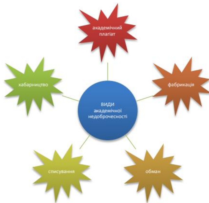
Рис. 1. Складові академічної недоброчесності