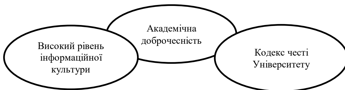
Рис. 2. Методи профілактики плагіату

Самі ж методи профілактики плагіату об'єднано у три групи (рис. 2).