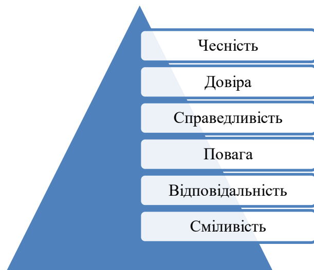
Рис. 2. Ключові цінності при формування академічної доброчесності

Коли мова заходить за академічну доброчесність, то говоримо про такі ключові цінності, що визначаються як фундаментальні (рис. 2).