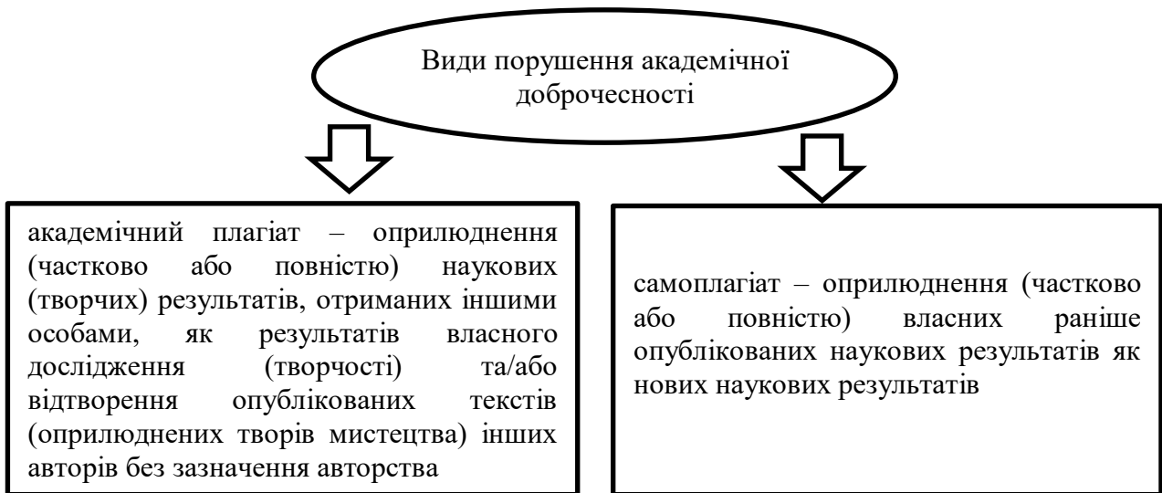
Рис. 1. Види порушення академічної доброчесності згідно Закону України «Про освіту»