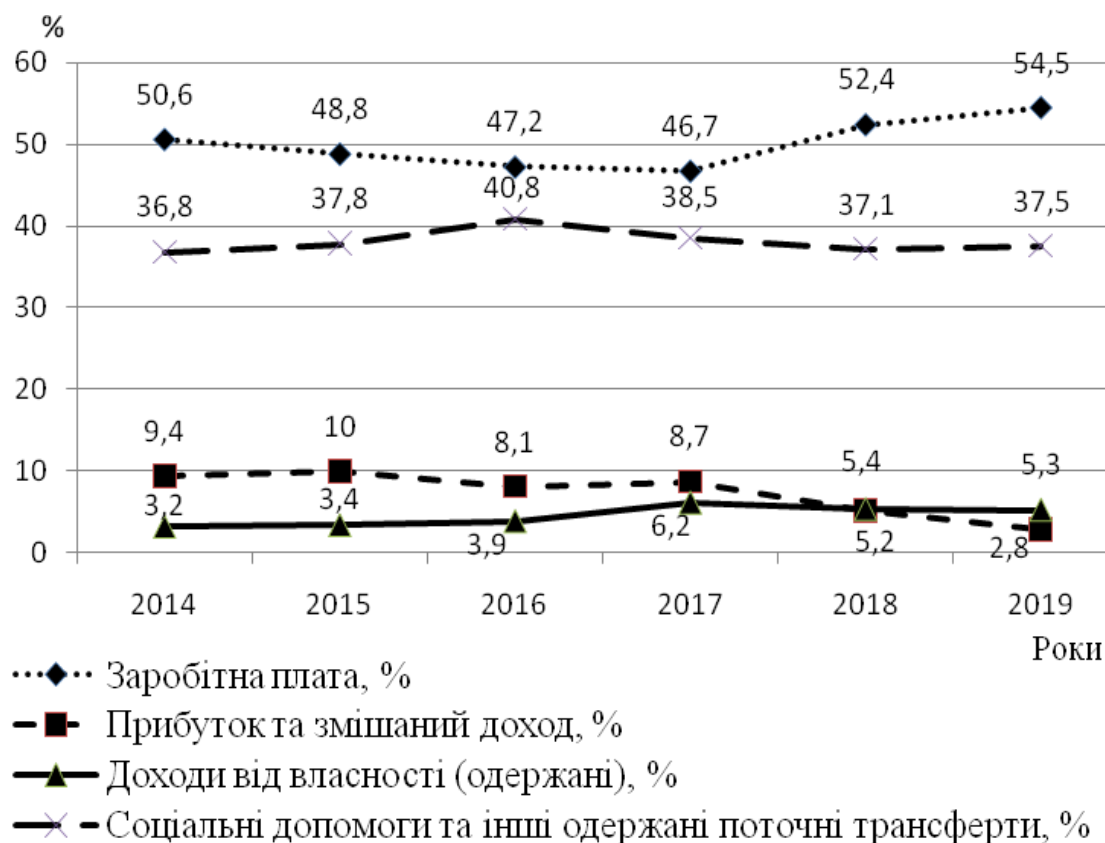
Рис. 3. Структурна динаміка доходів населення України у 2014-2019 рр.