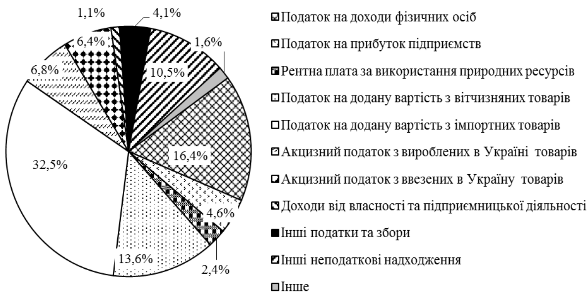
Рис. 2. Структура непрямих податків в Україні у 2020 р.

Ризикованість чинної системи оподаткування щодо спекулювання податковими ставками зумовила в 2020 р. зміни до Податкового кодексу України [9], які передбачають приєднання до міжнародної програми розширеного співробітництва BEPS і покрокове запровадження контролю за трансфертним ціноутворенням, оподаткування контрольованих іноземних компаній, обмеження витрат за фінансовими операціями з пов'язаними особами, запобігання зловживанням у зв'язку із застосуванням договорів про уникнення подвійного оподаткування, застосування процедури взаємного узгодження.