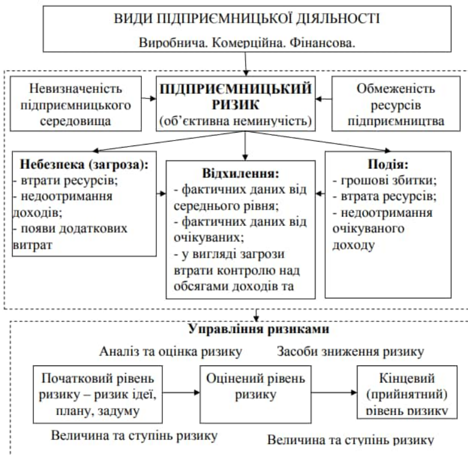
Рис. 5.26. Концепція підприємницького ризику

Розробка стратегії управління ризиками є одним із суттєвих задач підприємства, в процесі якої можна отримати чіткі відповіді на запитання наступного плану: які саме види комерційних ризиків підприємство зобов'язане враховувати у своїй діяльності; які способи й інструменти дають можливість управляти цими ризиками; який обсяг комерційного ризику підприємство може взяти на себе (прийнятна сума збитку, що може бути погашена з власних коштів).