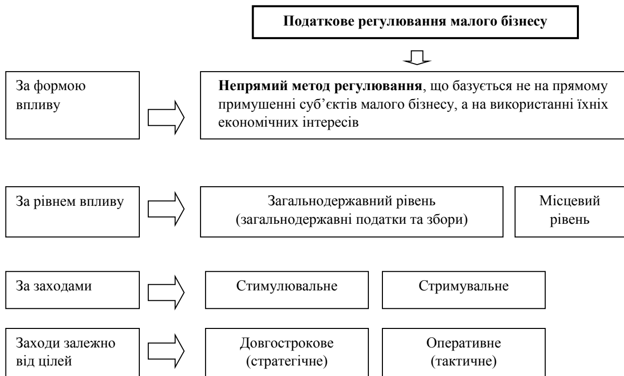
Рис. 2. Загальна класифікація податкового регулювання

розстрочки податкових платежів, надання податкового кредиту та податкових канікул, створює можливість для зниження податкового тиску та зміцнення фінансового стану суб'єктів малого бізнесу [16].