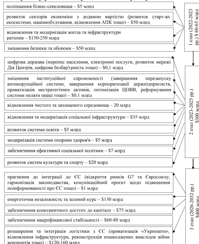
Рис. 2. Фінансування національних програм Плану відновлення України (на основі даних [15])

Цей план передбачено на десять років і пропонує нову модель відновлення держави за відповідними сферами впливу, включаючи 850 проєктів. Для його реалізації необхідне фінансування близько $ 750 млрд. Зауважимо, що План розроблено, зважаючи на перспективу інтеграції України в ЄС. Тому за умови його реалізації Україна має дотримуватись Копенгагенських критеріїв членства в ЄС, що дасть змогу підвищувати ефективність ринкової економіки та витримувати конкурентний тиск, дотримуючись цілей політичного, економічного, валютного союзу, будуючи свою політику на принципах демократії, верховенства права, поваги до прав людини і захисту національних меншин. Крім того, опираючись на наявні прецеденти в історії стосовно репарацій за завдані збитки через військову агресію, – перспективи виконання такого плану цілком реальні. Демократичний світ має фінансові можливості та юридичні механізми, які за умови об'єктивного підходу й застосування здатні змусити країну-агресора до виплат репарацій.