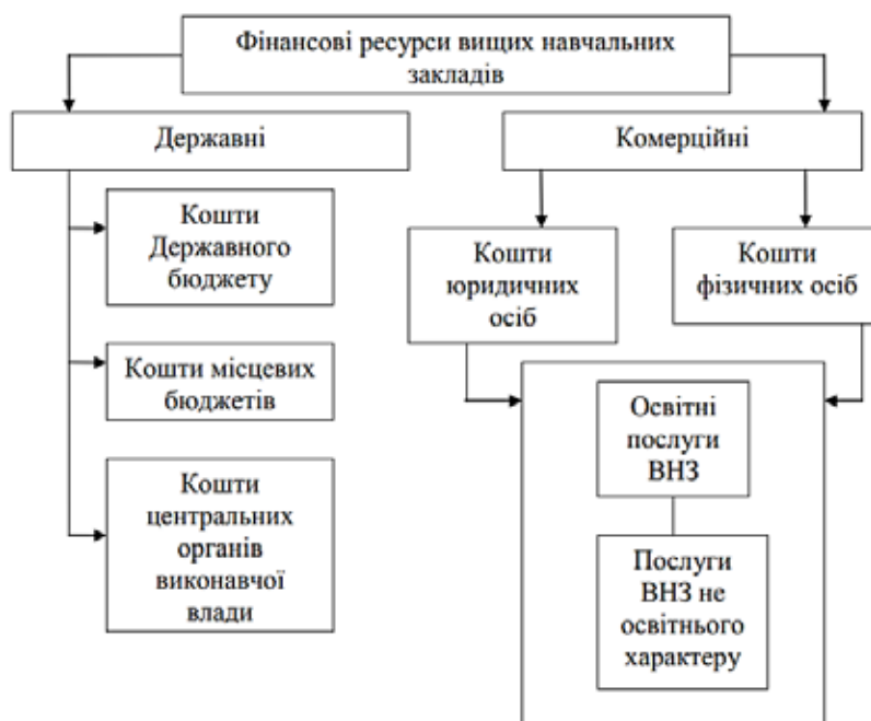
Рис. 1. Формування фінансових ресурсів вищих навчальних закладів