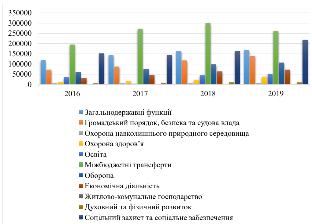
Рис. 2. Динаміка видатків Державного бюджету України, млрд. грн.