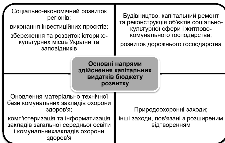
Рис. 1. Основні напрями здійснення капітальних видатків бюджету розвитку

Як видно з даних табл. 1, видатки бюджету розвитку м. Львова становили в 2018 р. – 2 661,4 млн грн, у 2019 р. – 2 955,1 млн грн, у 2020 р. – 3 170,5 млн грн. Сума видатків зростала кожного року, зокрема в 2020 р. вона зросла проти 2019 р. на 215,4 млн грн. Протягом 2020 р. найбільше коштів із бюджету розвитку м. Львова спрямовувалося на фінансування будівництва та ремонту об'єктів ЖКГ і доріг (25% від