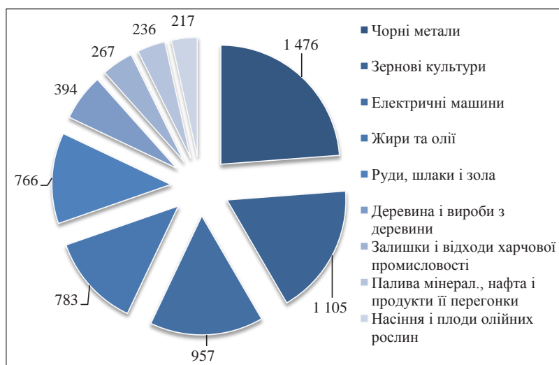
Рис. 1. Структура експорту товарів до країн ЄС за січень-червень 2017 р., млн дол. США

Як бачимо з рисунку 1 лідери продажів саме сировинна продукція – метало- та агропродукти. Єдиним винятком у цьому списку є експорт електротехнічної продукції. Його основу становить продаж автомобільного проводу – 60%. Це спричинено європейськими автомобільними підприємствами, які від-