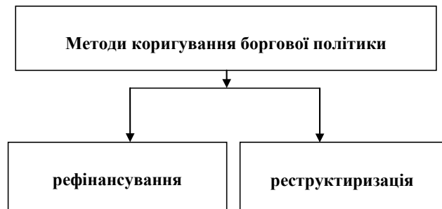
Рис. 2. Методи коригування боргової політики

Отже, для запобігання кризовим ситуаціям у сфері внутрішнього державного боргу, необхідно вдосконалювати систему управління державним боргом на основі розробки коротко – та довгострокових стратегій управління портфелем зобов'язань країни. Метою стратегії державних запозичень є визначення оптимальної структури та обсягу державного боргу з метою зниження