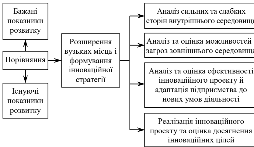
Рис. 1.1. Етапи розроблення стратегії інноваційного розвитку