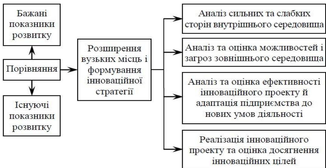
Рис. 1.1. Етапи розроблення стратегії інноваційного розвитку